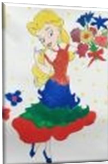
rys. klasa 5b