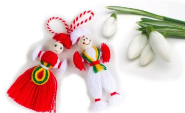
Чечмума Баба Марта!

czerwonymi gałgankami włóczki. Są one także wieszane na drzewach, w oknach i wielu innych miejscach.